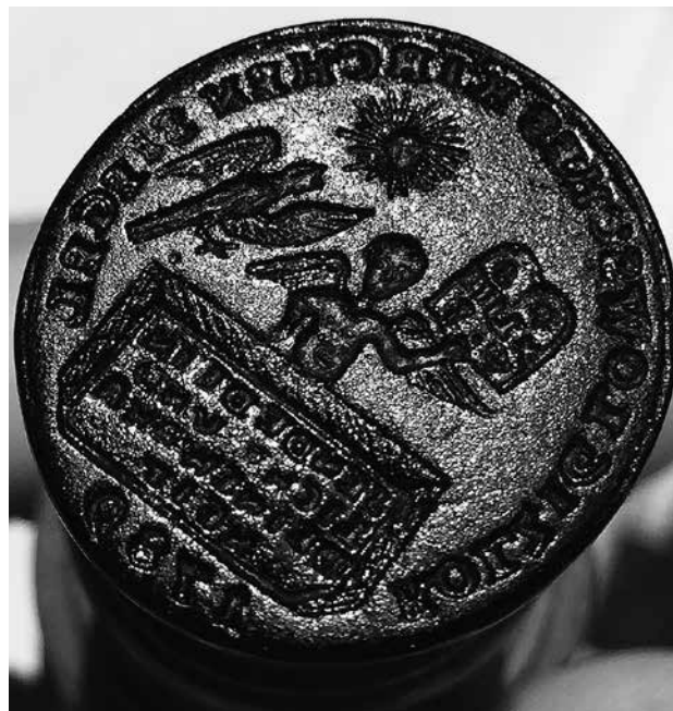
Abb. 3 Siegelstempel von 1789 der Kirche von Alt Kolziglow im Kreis Rummelsburg in Hinterpommern.

Der ganze Vorgang zeigt aber wieder einmal, auf welche Kleinodien pommerscher, preußischer und deutscher Geschichte man in einem Pfarrarchiv stoßen kann. Die Wertschätzung unserer Zeit sollte deshalb nicht nur dem Baubestand und dem kunstgeschichtlich wertvollen Inventar unserer Kirchen gelten, sondern auch die Bewahrung und Sicherung des Archiv- und Bibliotheksguts zwingend in den Blick nehmen.