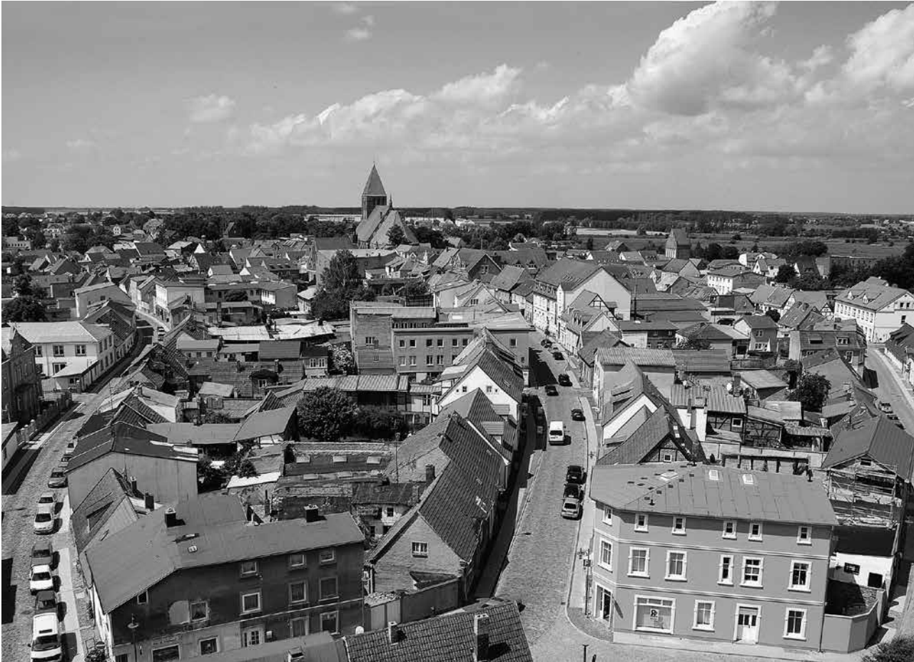
Abb. 2 Vom Wasserturm, der sich seit 1933 an der Stelle erhebt, an der bis ins 18. Jahrhundert das landesherrliche Schloß stand, ist eine gute Übersicht über die Altstadt von Grimmen gegeben.

komplexen Materie zu ermöglichen. Während im ersten Abschnitt eine systematische und chronologische Darstellung aus der Feder eines Autors gewählt wurde, stehen in den folgenden drei Abschnitten die Einzelbeiträge verschiedener Autorinnen und Autoren im Vordergrund, in denen neue Erkenntnisse zur kirchlichen Bau- und Kunstgeschichte, die Quellen der Kirchen- und Stadtgeschichte sowie die zeitgeschichtliche und aktuelle Dokumentation in den Mittelpunkt gerückt werden.